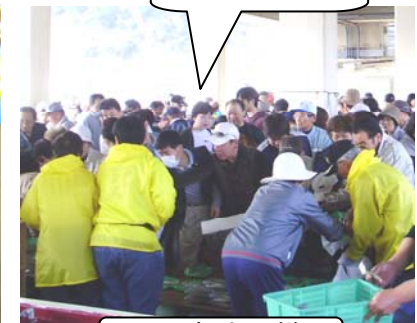
当日の朝市の様子