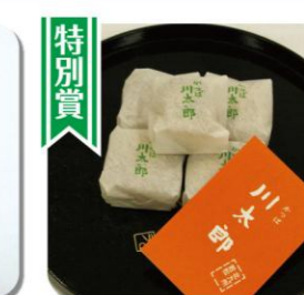
【特別賞】かっぱ川太郎 ※現在閉店しています。