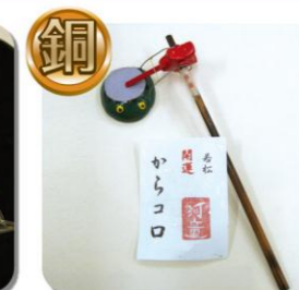
【銅賞】若松開運からココ