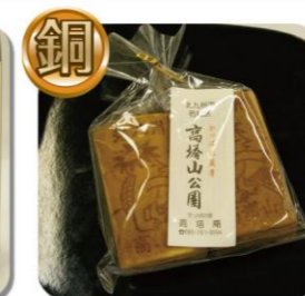
【銅賞】河童せんべい