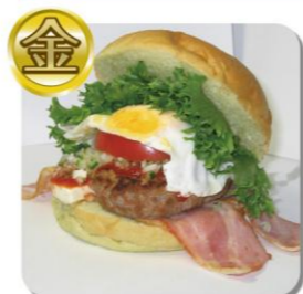
【金賞】若松かっぱー