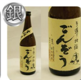
【銀賞】本醸造 ごんぞう